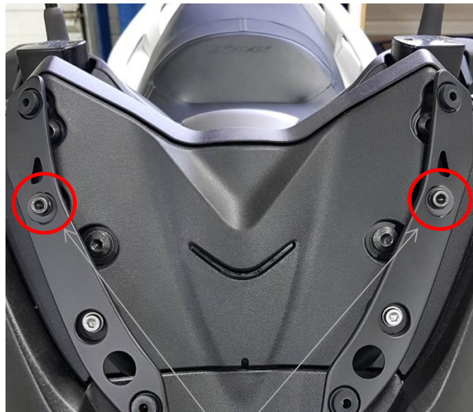
Location of the screws to replace